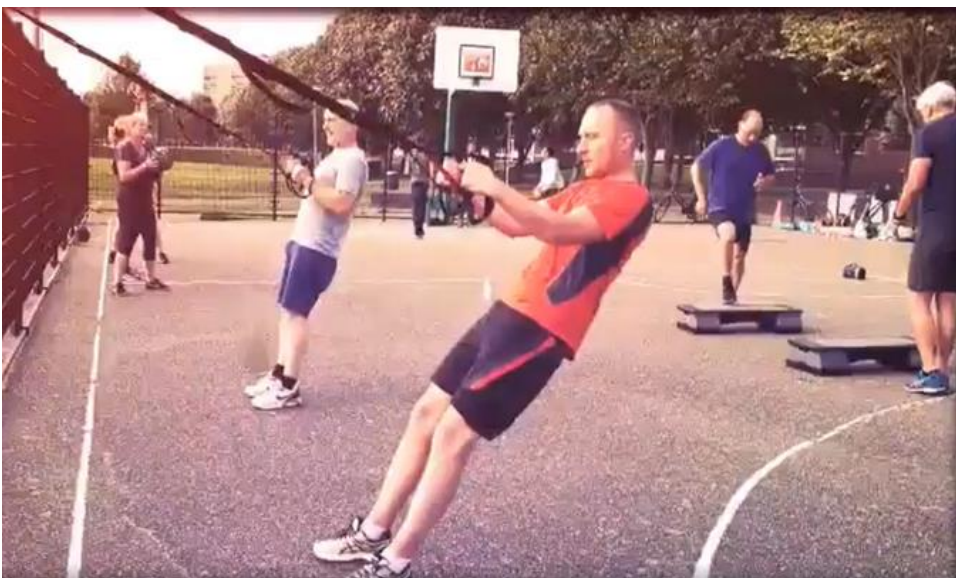
De opbouwwerker doet mee met de buurtgenoten die deelnemen aan de wekelijkse bootcamp.