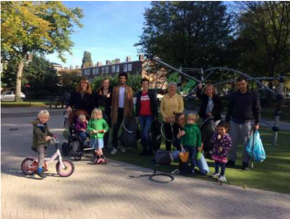
Groep actieve bewoners in Sloterveer die zelf hun buurt schoonprikken.

Wij hebben in 2019 flink geïnvesteerd in het opknappen van activiteitenruimtes en de ontmoetingsruimte vanuit onze reserve. Daarnaast heeft de gemeente Amsterdam het mogelijk gemaakt dat wij een speciale computerruimte (Digiroom) hebben kunnen inrichten waar bewoners en collega instellingen les kunnen geven in digitale vaardigheden.