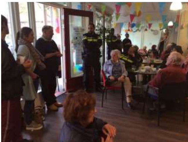
Opening van Buurthuis kamer de Cactus