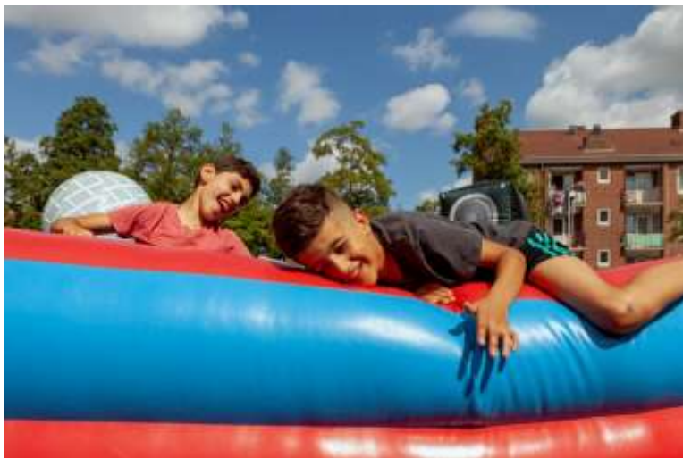
Buitenspeeldag Slotermeer, georganiseerd in samenwerking met Stichting DOCK.