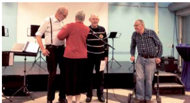
De commissie van drie wijze mannen.

Om elkaar nog beter te leren kennen vertellen de leden van het Algemeen Bestuur iets over hun vrijwilligerswerkzaamheden.