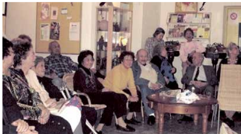
Bij Stichting de Brug.