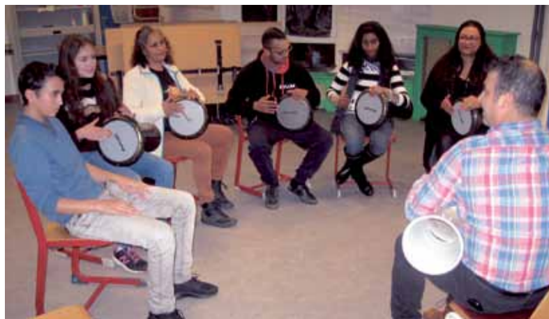
Workshop djembé in Huis van de Wijk de Aker

vertelde: "De Dag van de Mantelzorg geeft een stukje waardering voor het onzichtbare wat je doet. Ik kwam hier in Huis van de Wijk en mensen keken op dat ik er ook was. Sommigen wisten niet dat ik mantelzorger ben. Het fijne is dat je het niet hoeft uit te leggen, de anderen snappen wat je mee maakt. Je bent met elkaar en je kunt je gevoel delen."