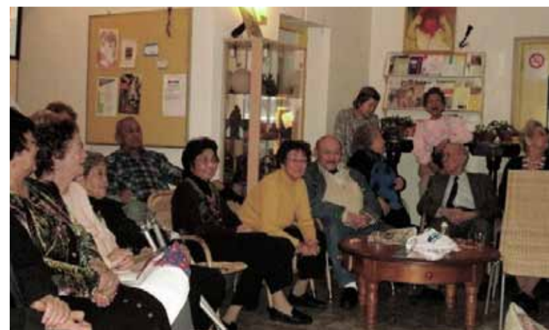
Een huiskamer voor de buurt.

Om elkaar nog beter te leren kennen vertellen de leden van het Algemeen Bestuur iets over hun vrijwilligerswerkzaamheden.