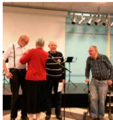
De commissie van drie wijze mannen.

De Open Club biedt een gevarieerd programma aan in 2 periodes van het jaar: januari t/m mei en september t/m december. Er is aandacht voor film, muziek, kunst, geschiedenis, reizen en voordrachten.