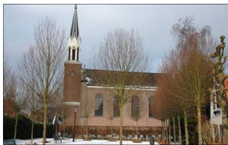
De Sloterkerk herkenbaar aan de witte torenspits.