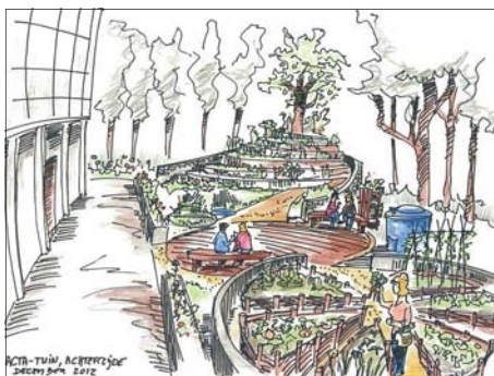
Artist impression van Bert van Waterschoot

Vanaf maart wordt begonnen met de aanleg van een eetbare, ecologische tuin rondom het ACTA-gebouw. Als je interesse hebt om mee te helpen met het ontwerp, de aanleg, het onderhoud, de oogst, of een leuk idee hebt, ben je van harte welkom. Ervaring is niet nodig! 1+2 maart='ontwerpatelier', 23 maart='aanlegdag' en elke vrijdag 13-17u='tuinwerk en borrel'. Aanmelden via acta-tuin@urbanbio.nl of Facebook https://www.facebook.com/ActaTuin?ref=hl ◀